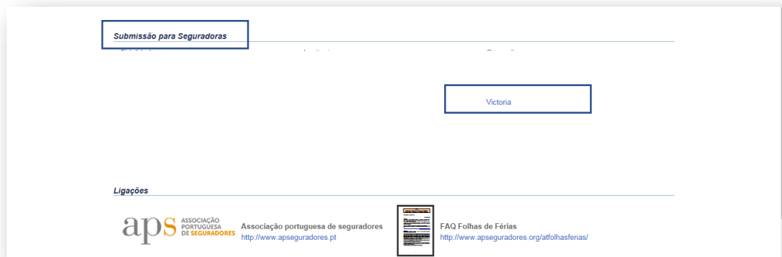
Figura 3 – página inicial da funcionalidade disponibilizada pela APS, com destaque à Submissão para Seguradoras.

Após criar e/ou validar o seu ficheiro de Folhas de Férias, deve ir à área de Submissão para Seguradoras, escolher a VICTORIA e anexar ao e-mail o seu ficheiro.